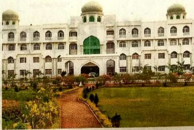
Of the 2,788 admissions in various regular courses this year, up to 38 per cent comprised women.

This apart, the university has been giving a fee waiver for women in the first semester besides 100 per cent