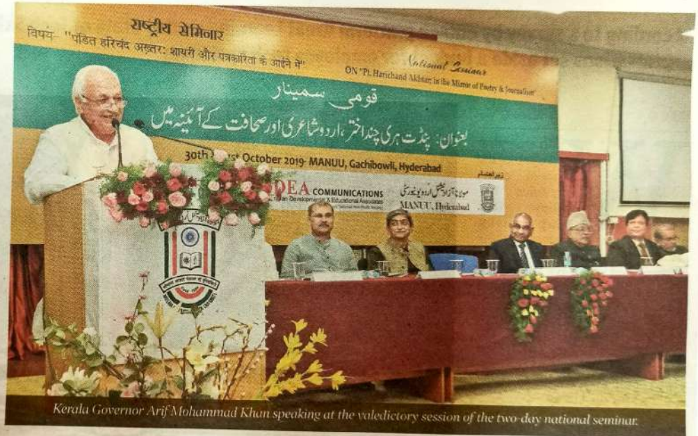
Kerala Governor Arif Mohammad Khan speaking at the valedictory session of the two-day national seminar.